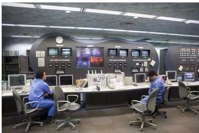
Рис. 5. - Здание мусоросжигательного завода "Maishima". Интерьер рабочих комнат инженерной службы.

URL: archdaily.com/content/about?ad_name=top-secondary .