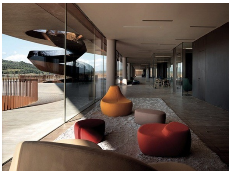
Рис. 2. - Винный завод «Cantina Antinori Winery», архитектурная студия «Archea Associati». Перспектива фойе.

URL: archdaily.com/content/about?ad_name=top-secondary .