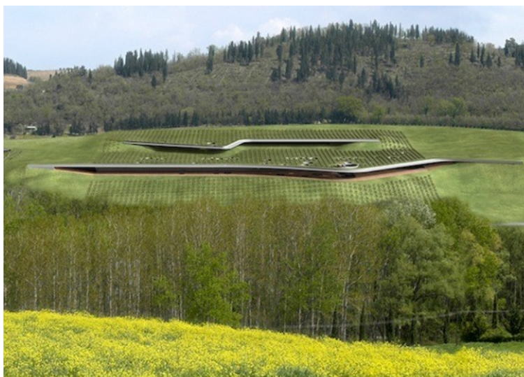
Рис. 1. - Винный завод «Cantina Antinori Winery», архитектурная студия «Archea Associati». Общий вид.

Интересным примером нестандартного использования рельефа является подземный винный завод фирмы "Cantina Antinori Winery" разработанный архитектурной студией "Archea Associati" (рис. 1, 2.) [9]. Производственные, складские и административные помещения располагаются под слоем грунта на котором высажены виноградники. Это позволяет сократить затраты на обогрев самих помещений, в то время как корни лозы обогреваются.