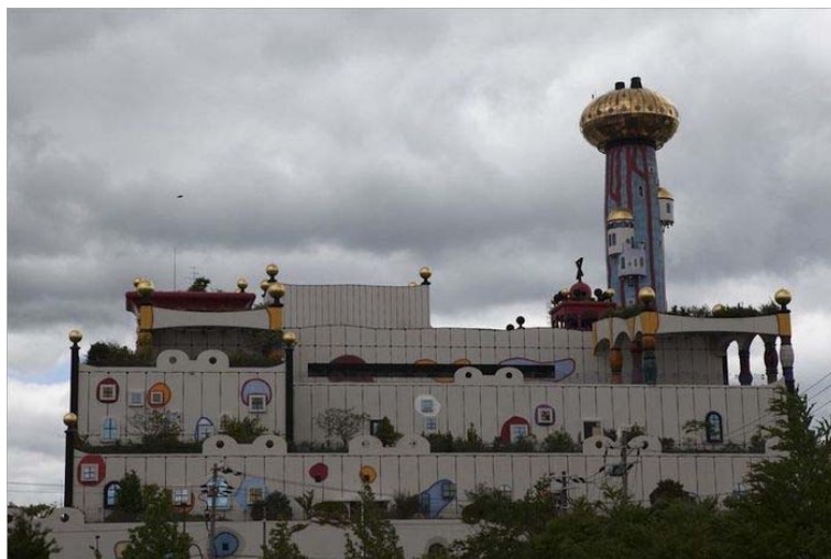
Рис. 4. - Здание мусоросжигательного завода "Maishima". Общий вид.

Примером высокой эстетической экологичности и нестандартным подходом к формированию образа производственного сооружения является мусоросжигательный завод "Maishima" в г. Осака. (Рис. 4, 5) [9] . Его архитектурный образ, идущий вразрез с традиционным восприятием подобного рода объектов, не только мотивирует сотрудников, но и меняет отношение городского сообщества, повышая имидж компании "Maishima" и города в целом.