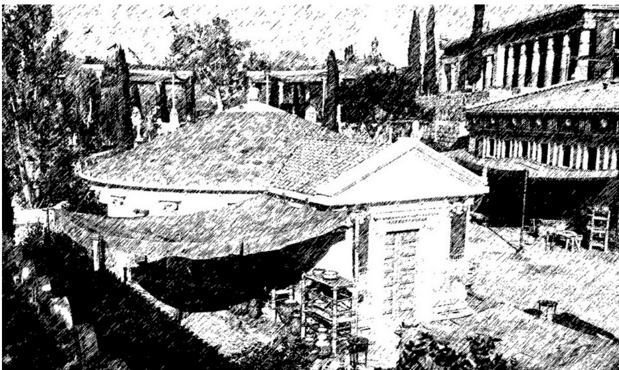
Рис. 3 – Графическая реконструкция афинского Пританея в V в. до н.э. (Рисунок автора).

Рассмотрим еще несколько построек общественных зданий, формировавших общую застройку городского центра.