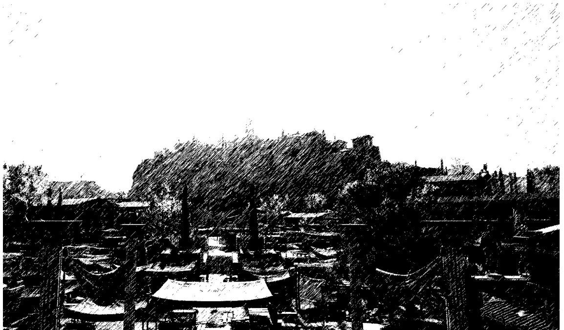
Рис. 1 – Вид на афинский Акрополь в V в. до н.э. Графическая реконструкция. (Рисунок автора).

зажигались огни, дабы морякам был виден вход в Пирей. К III в. до н.э. размеры гаваней могли достигать внушительных размеров. В Сиракузах и Антиохии появились башни маяков и даже колоссы, наиболее известными из которых стали Александрийский маяк и Колосс Родосский, получившие вскоре статус «чудес Света». Гавани могли быть торгового или военного назначения, нередко имели внушительные размеры и протяженный периметр каменных стен.