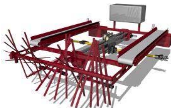
Рис. 2 Навесной роботизированный модуль.

Основная функциональность робота-сборщика реализована в навесном роботизированном модуле, представляющим собой раму с двумя манипуляторами, ленточным транспортером, ворошителем и системой датчиков для распознавания плодов (рисунок 2).