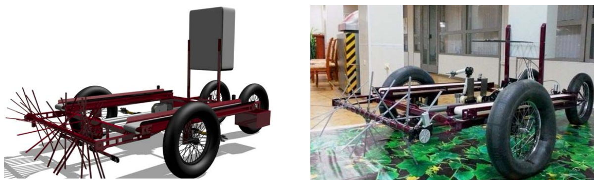
Рис. 3 Тестовая платформа. 3D модель и ее реализация.

Для отработки основных алгоритмов была разработана тестовая платформа, состоящая из навесного роботизированного модуля и транспортной платформы на шинах низкого давления (рисунок 3).